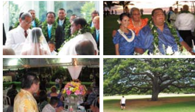
ショーに夢中の局長 この木なんの木だろ?気になる木だな~

2008年8月23日にハワイ・オアフ島で親族・知人500人を集めて盛大な挙式とパーティーが行われました。