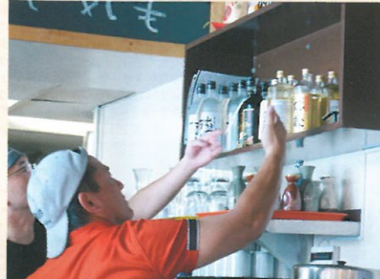
開店前の店内チェック。棚からお客様が産る椅子やテーブル、照明の 隅々までホコリがついていないか隅々まで目を配る。「お客様には心地良 く楽しく過ごしてほしい」と重田。