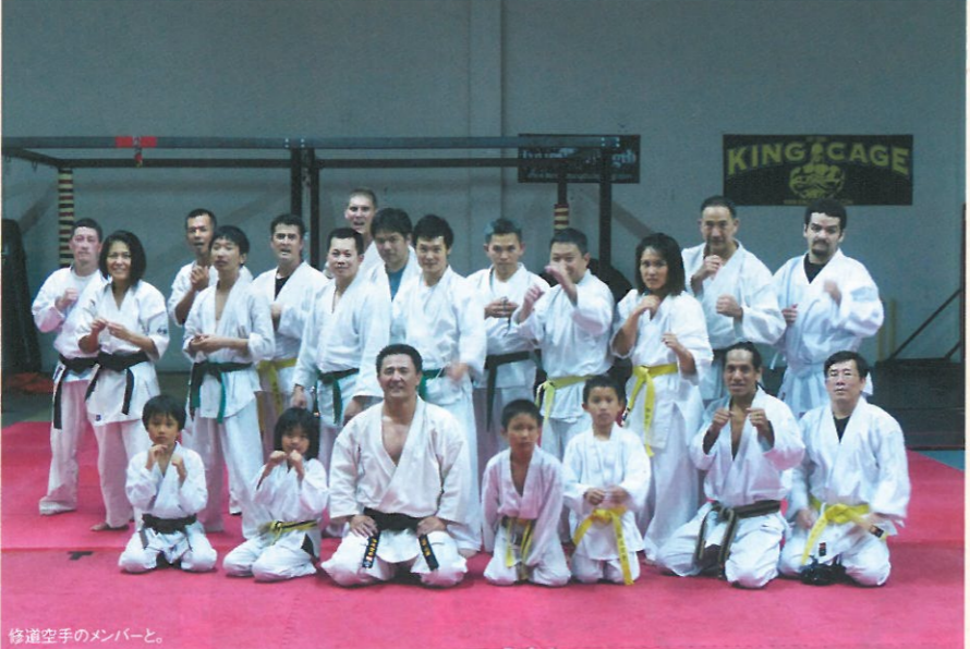
修道空手のメンバーと。