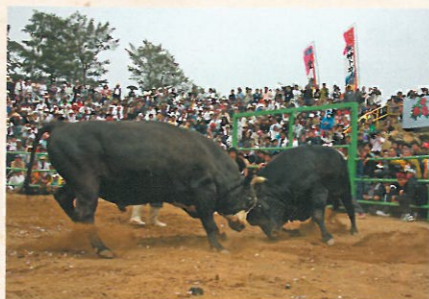
徳之島といえは闘牛が盛ん。1トクラスの牛が角を突合せ戦う。重 田の闘牛「びよーくわ」は横綱となった。